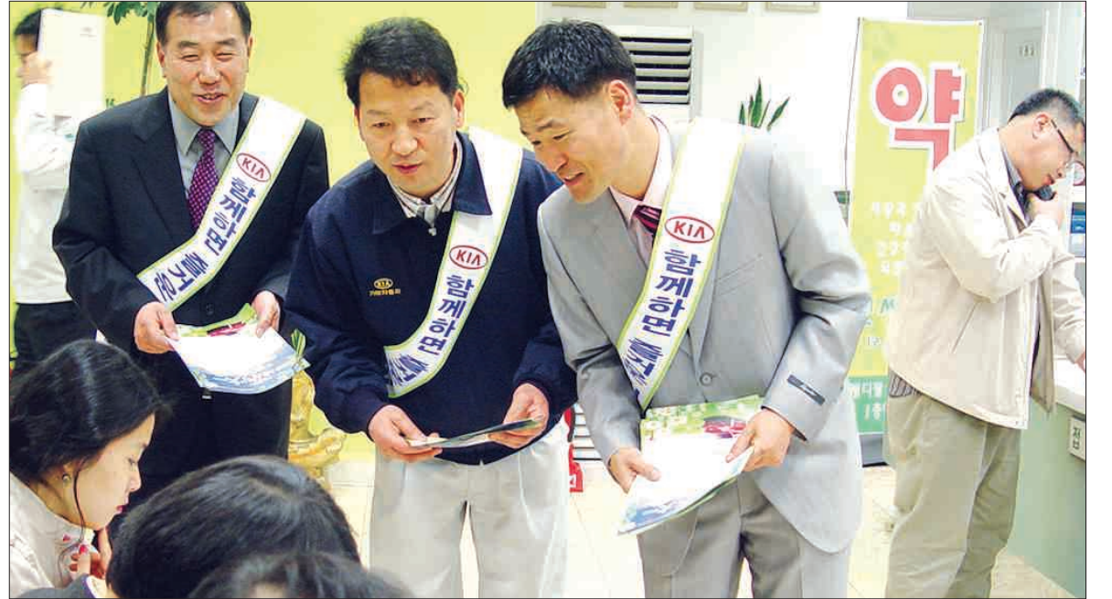
“기아차 타보셨어요” 기아자동차 현장근로자와 영업사원들이 16일 광주 광천동 고속버스터미널과 주변상가 등지에서 시민들에게 기아차 홍보리플렛을 나눠주며 관측활동을 벌이고 있다.