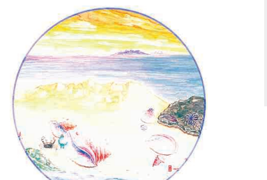
'소리 바닷가 향기'

서양화가 김남일씨가 갤러리 자리아트에서 '봄이 오는 길목에서'를 주제로 18일부터 24일까지 개인전을 갖는다.