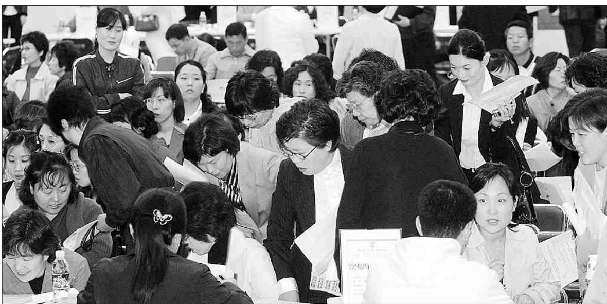
“일자리 없어요” 복직 담을 했다.

◇피해 실태=광주시 소방본부에 따르면 13개 아파트에서 1천406개의 관창이 없어졌다. 피해 아파트는 ▲중앙동 부영 2차(390개) ▲대방동 내방주공(300개) ▲상무 버들주공 2단지(200개) ▲용봉동 현대 3차(160개) ▲유촌동 상무 버들주공 1단지(96개) ▲용두동 양산타운(65개) ▲양산동 청안(58개) ▲월곡동 금오(52개) ▲신가동 중흥 2차(30개) ▲운암동 대주(20개) ▲진월동 한신 1차(15개)