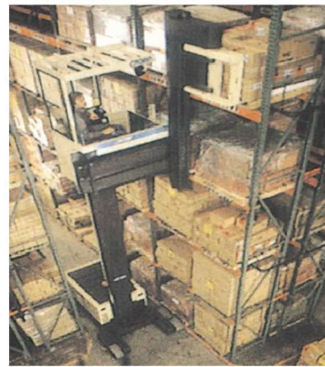
자동창고 및 물류 배송센터 ▶

배터리 성능이 아직 남아있는데도, 충전 불량이나 수명감소가 발생하는 가장 큰 이유는 연판에 생긴 황산염 때문입니다. 배터리 닥터는 프로뱃(Probat)과 프로차지(Procharge)라는 최첨단 과학으로 황산염을 제거하고 생성을 억제함으로써 폐배터리를 새것과 동일한 성능으로 회복시켜드립니다.