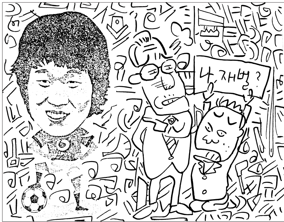
찾아보세요! 셔틀룩, 다리미, 음표, 담배파이프, 병따개, 새집, 바늘, 종이배, 은행잎