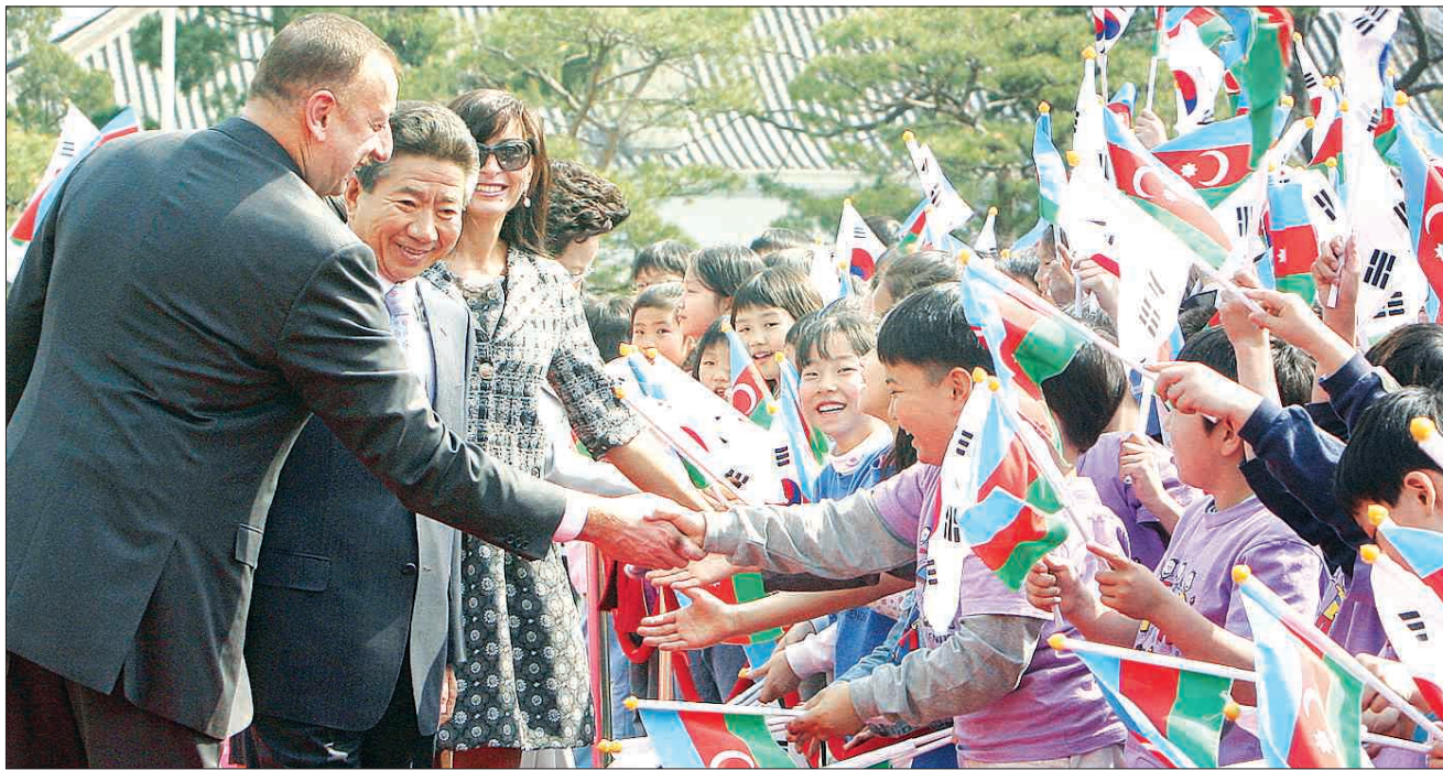
아제르바이잔 대통령 공식 환영식

참여정부 출범 초기인 2003년 3월 7천 794개였던 총 규제 수는 2004년 3월 7천 891개, 2005년 3월 7천883개, 2006년 3월 8천24개, 2006년 6월 8천29개로 3년3개월 간 3% 가량 증가했다. /연합뉴스