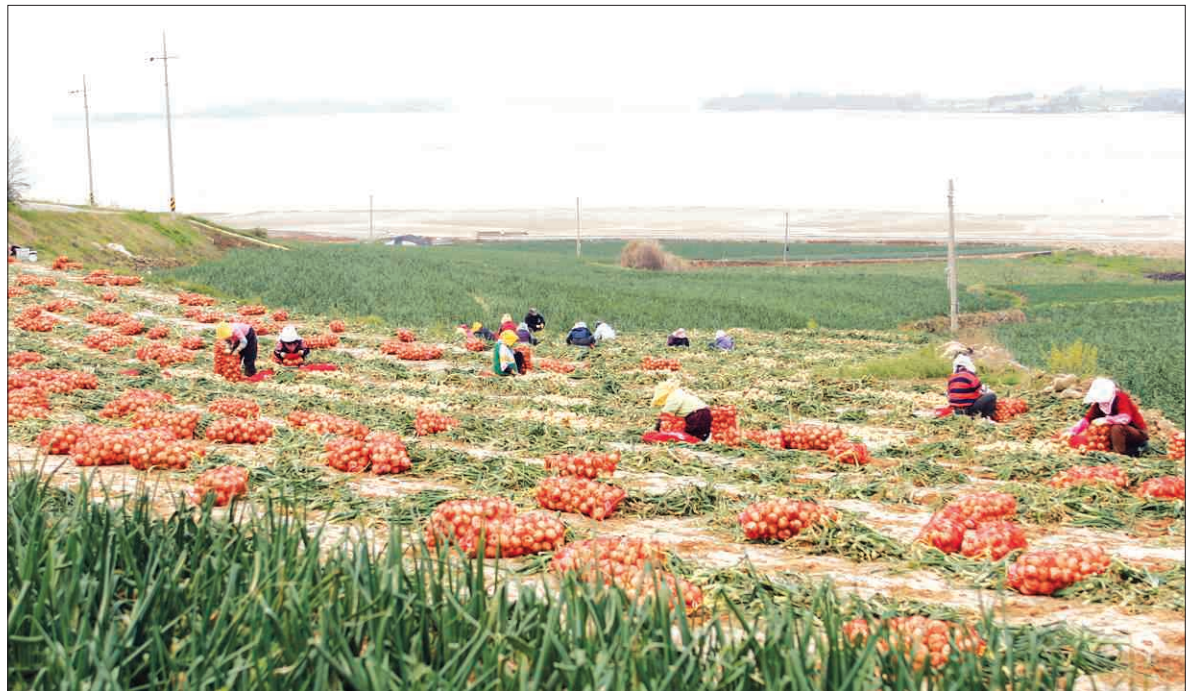
양파 주산지인 무안에서 조생종 양파 수확이 한창이다. 그러나 공급 과잉으로 햇양파값이 폭락, 재배 농민들의 어려움이 가중되고 있다. /무안=이원희기자 whlee@

모내기를 하려면 다음 달에는 수확을 마쳐야 한다"고 말했다. 이에 따라 전남도와 일선 지자체, 농협 등은 농민피해를 최소화하기 위해 양파소비 촉진 운동을 발의 계획 중이다. 무안군 관계자는 "5월초 제주지역 양파 출하가 마무리되면 가격이 회복 될 것"으로 전망했다. /무안=이원희기자 whlee@