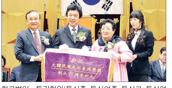
학교법인 동강학원(동신중·동신여중·동신고·동신여고)·후성학원(동강대학)·해인학원(동신대학교) 창립 제41주년 기념식이 23일 동강대학 본관 5층 대강당에서 열렸다.