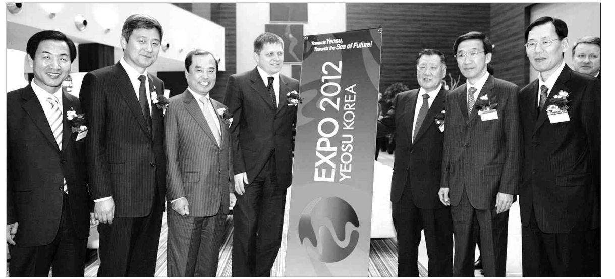
지난 23일(현지시각) 오후 슬로바키아 질리나시 홀리데이인 호텔에서 열린 기아차 공장 준공기념 만찬에서 참석자들이 여수박람회 로고를 배경으로 서있다. 왼쪽부터 오현섭 여수시장, 서갑원 국회의원, 김병준 정책기획위원장, 로베르토 피초 슬로바키아 수상, 정몽구 현대·기아차 회장, 이인기 국회의차위원장.

다 한미FTA 보완대책, 2단계 균형발전계획 등에도 재원이 필요하기 때문에 재정지출 증가율이 높아졌다"고 설명했다. 기획처는 내년에 재정지출이 늘어나지만 국내총생산(GDP) 대비 국가채무의 비중은 올라가지 않도록 관리할 예정이다. 기획처는 "내년도 경제성장률은 실질기준으로는 5%, 경상으로는 7% 안팎 정도로 예상되는 만큼 정부가 확보하는 세수도 늘어났다"면서 "비과세·감면 축소, 정부보유 은행지분 매각 등의 조치를 취하는 등 재정건전성이 유지되도록 노력하겠다"고 말했다. /채희종기자 chae@kwangju.co.kr