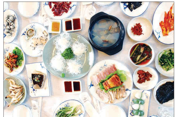
'청자골 증가집'은 해물과 육류 등이 한데 어우러져 나오는데 그 양에 한 번 놀라고, 맛에 또 한 번 놀란다.