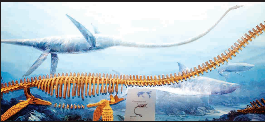
국내 최초로 전시된 해양파충류실.