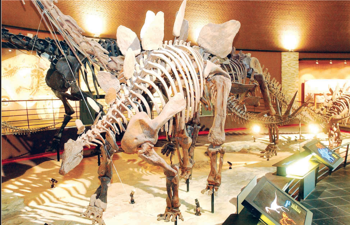
지하1층, 지상 2층, 연면적 2천400여평의 규모의 우항리 박물관은 알로사우루스 외 200여점의 희귀 공룡화석이 전시됐다. 중생대 재현실에서는 보행하는 말라위사우루스 모습을 볼 수 있다.

설레임과 약간의 두려움을 갖고 입구에 들어서면 '우항리실'이 마련돼 있다. 세계적 유적지인 우항리에서 발굴된 화석의 실물을 관찰하고 해남의 지질형성 과정과 연대별 특징을 파악할 수 있다.