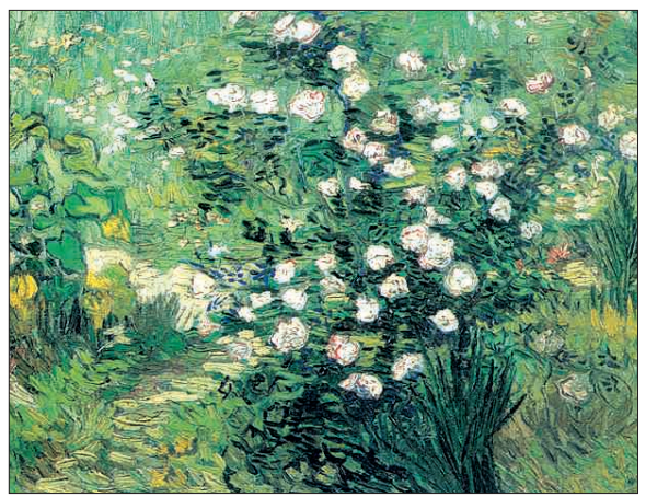
국립서양미술관이 소장하고 있는 대표적인 명작인 르누아르의 '모자를 쓴 여인', 모네의 '수련', 고흐의 '장미'(위로부터).

20세기를 대표하는 프랑스 건축가 르 코르뷔지에가 설계한 국립서양미술관은 단아한 외형과 빼어난 접근성 때문에 해외 관광객과 현지인들에게 사랑받는 공간이다.