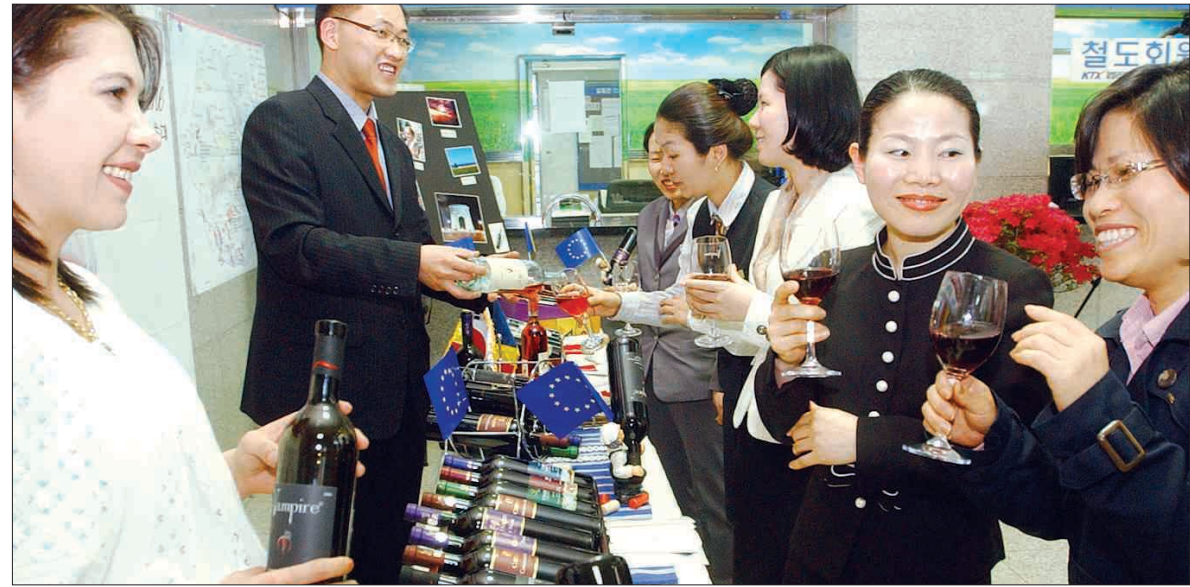
KTX ‘와인 시음회’ 한국철도공사 광주지사는 26일부터 이틀간 광주역내 맞이방에서 ‘KTX개통 3주년 및 승객 1억명 돌파’ 기념으로 ‘와인 시음회’를 개최하고 있다. 이 행사는 오후 2시부터 6시까지 진행되며 루마니아산 레드 와인·화이트 와인 등 5종류를 시민들에게 제공한다.