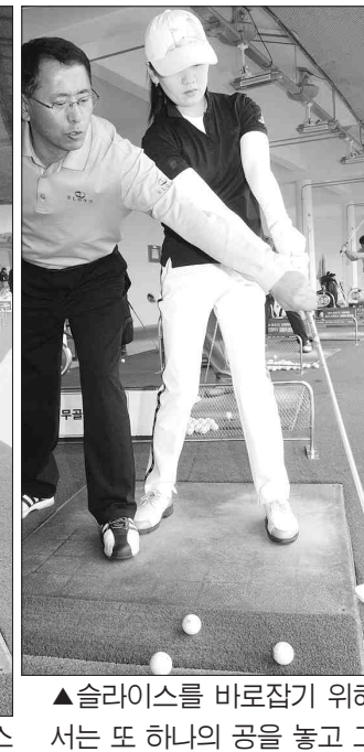
▲테이크 백에서 톱에 이룰때 손목코킹이 안된 동작(왼쪽)과 손목코킹과 어깨턴이 된 잘된 동작.