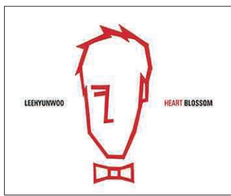
〈이현우와 10집 앨범〉

다음날'을 만든 김홍순과 작업을 진행했다. 타이틀곡은 '거짓말처럼 기적처럼'. 로커 김중서는 데뷔 20주년 기념 베스트 음반 '명작(名作)'을 발표했다. 솔로 데뷔는 1992년이지만 그의 첫 공식 음반인 1987년 그룹 시나위 2집을 기점으로 계산했다. 2장의 CD에 모두 27곡을 담은 이번 음반에는 신곡인 '아이 러브 유(I Love You)'를 비롯, '겨울비' '아름다운 구속' '대답 없는 너' 등 히트곡을 재녹음했다. 또 윤도현·전제덕·JK김동욱·노보래인 등 후배 가수들이 재해석한 곡도 담았다. 저력을 보이고 있는 '라이브의 황제' 이승철은 지난해 가을 내놓은 8집 앨범 'reflection'에서 연속적으로 히트곡을 내놓으며 상승가를 치고 있다. '소리쳐'를 1위에 랭크시킨 데 이어 '하얀새'가 인기를 모았으며 최근에는 '시계'가 다시 온라인 차트 1위를 기록했다. 또 리사와 함께 부른 '시작보다 끝이 아름다운 사랑' 역시 한때 빅스 차트 1위를 차지하는 등 인기를 모으고 있다. 그밖에 김건모의 '스타일 앨범 11'은 김건모의 16년 음악 인생을 고스란히 담은 음반으로 타이틀곡 '허수아비'가 많은 사랑을 받고 있으며 양희은의 노래를 리메이크한 '사랑, 그 쓸쓸함에 대하여' 등이 실려 있다.