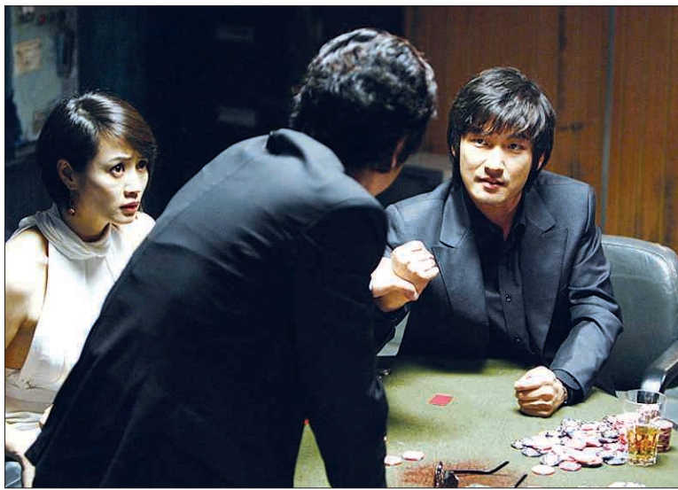
도박을 다룬 영화 '타짜'를 통해 저자는 도박 중독은 사회 윤리적인 비난을 전제로 한 형벌 대신 적절한 치료 방법으로 대응해야 한다고 말한다.