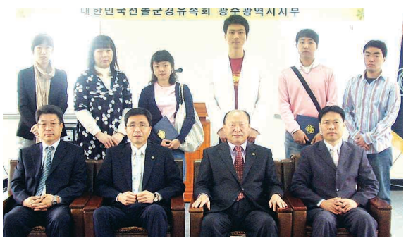
대한민국 전물군경유족회 광주시지부는 지난달 30일 지부 사무실에서 '2007년 장학증서 전달식'을 갖고 전물군경유자녀들에게 장학금을 전달했다.