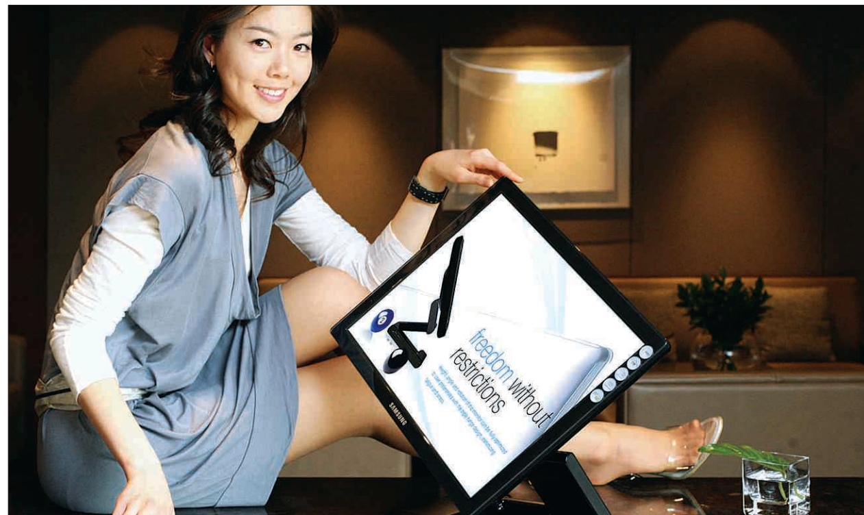
삼성전자가 1일 업계 최고 명명비로 업그레이드된 독특하고도 우아한 디자인의 '컬렉션 모니터' 모델명 : 심크마스터 CX971 P, 19인치 LCD 모니터를 출시. 인가물이에 나섰다.

중 2천369명으로 이 가운데 보충역은 1천503명이다. 나머지 인력 866명은 현역요원으로 정보통신부와 문화관광부가 각각 추천한 정보처리 분야 703명과 게임 소프트웨어 분야 163명이다.