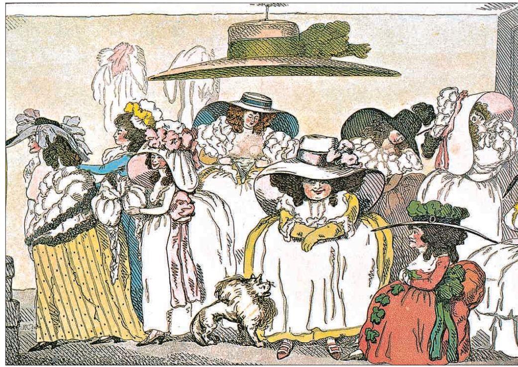
18세기 여성들의 거대한 모자 패션을 풍자한 캐리커처. 영국 롤랜드슨 작(1786년).