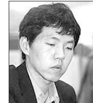
이창호 9단이 3개월 만에 랭킹 1위로 복귀했다.