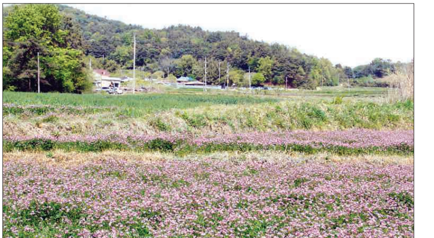
운수 절골마을과 무네밧재.

한창 건설되고 있는 광주~무안간 고속국도 어귀가 될 광산구 운수동(雲水洞)에 이르러 평동산단길에서 북쪽으로 접어드는 오솔길이 보인다. 바로 옛길 모습을 그대로 간직하고 있다.