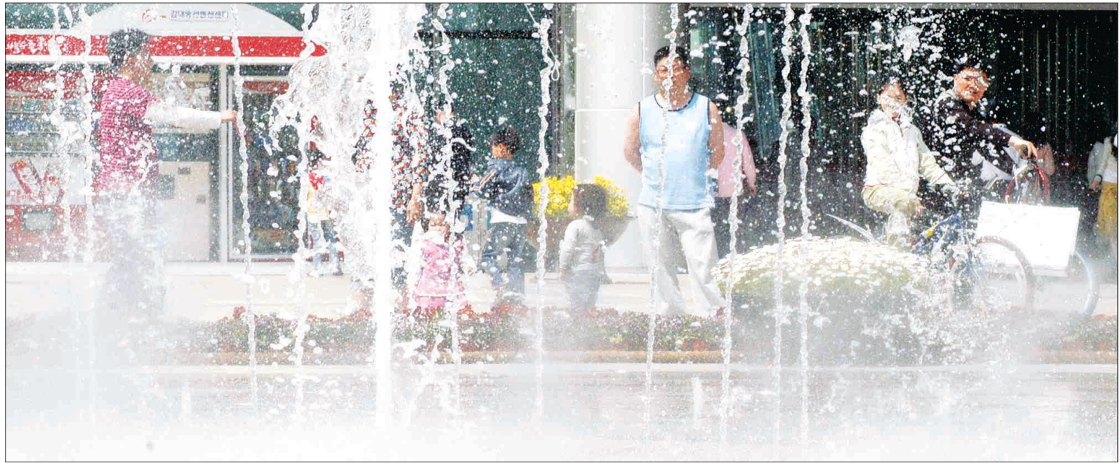
벌써 한여름... 나주 28℃ 30도에 육박하는 초여름 날씨가 계속되고 있는 7일 광주 김대중 컨벤션센터 앞 음악분수대에서 시민들이 시원한 물 줄기에 몸을 적시고 있다. 이날 광주·전남지역의 낮 최고기온은 나주 28도를 최고로, 광주 26.5도, 구례 27.9도를 기록했다. 광주지방기상청은 고기압의 영향으로 8일 광주 낮 최고기온이 28도까지 오를 것으로 예보했다.