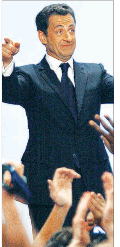
6일 치러진 프랑스 대선 결선투표에서 5년 임기의 대통령에 당선된 우파 대중운동연합(UMP)의 니콜라 사르코지가 파리 시내 샬 가보에서 연설하기 위해 도착, 군중들로부터 박수 갈채를 받고 있다.