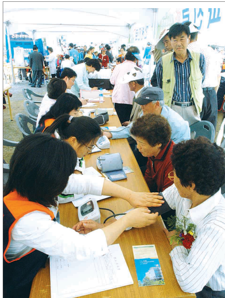
“무료진료 고마워라” ‘제4회 남구민의 날’을 맞아 8일 오전 11시부터 오후 5시까지 백운광장 옆 홀플러스 부지에서 ‘효사랑데이’ 무료진료 행사가 펼쳐졌다. 내과·한방 진료 등 건강검진과 안과·발마사지·수지침 등의 서비스를 이용하는 노인들의 발걸음이 하루 종일 이어졌다.

사와 시민이 조사를 받았던 지하 강당과 건물이 보존돼 있고, 30년 이상 성장한 아릅다운 나무가 즐비해 5·18 교육의 현장과 휴식공간으로써 손색이 없는 것으로 알려졌다. 기념재단 관계자는 “기무부대 부지를 26번째 5·18사적지로 지정하기 위해 5월 중 세미나를 열 계획”이라며 “국방부와 광주시에 지속적인 청원운동을 펼치겠다”고 말했다. 한편 광주에는 옛 전남도청 건물을 비롯한 5·18 관련 사적지로 지정된 곳이 25곳이며 대표적인 사적지로는 전남대학교 정문·상무관·남동성당 등이 있다. /안현주기자 ahj@kwangju.co.kr