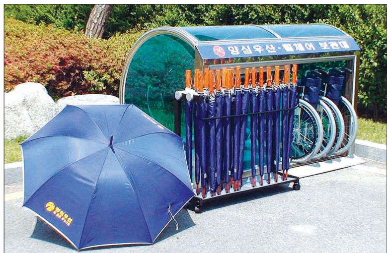
“양심우산 이용하세요” 광주시는 8일 청사 주차장 일구에 양심우산·휠체어 보관대를 설치하고 민원인들에게 서비스하기 시작했다.

이에 따라 75.3%의 아파트 단지가 관리규약을 개정해야 한다는 의견을 제시했다. 이들 아파트단지는 ▲선거 관리위원회 구성(63.6%) ▲입주자 권한강화(65.4%) ▲입주자대표회의 권한축소(73.8%) 등을 희망했다. 2006년 말 현재 광주시의 아파트는 모두 782개 단지로, 설문 대상 240개 단지 가운데 191개 단지가 설문에 응했다. 또 설문대상 아파트 중 98.4%인 188개 단지가 자치관리기구가 구성·운영 중에 있었다. 광주시는 이를 의견이 반영된 새로운 아파트 관리규약을 만들어 하반기 중에 시행하도록 한다는 계획이다. 시 관계자는 "과반수의 아파트에서 분쟁이 발생하고 있는 만큼 관리규칙을 개정해 관련 단체와 협의의 거쳐 고시·시행할 방침"이라고 밝혔다. /김주정기자 jjnews@kwangju.co.kr