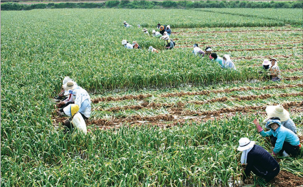
고흥 햇마늘 수확 한창