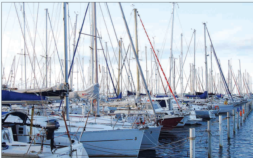
그랑모뜨의 경쟁력은 어디에 내놓아도 손색없는 마리나 시설이다. 마리나에 정박중인 수많은 요트들이 그랑모뜨의 활기를 대변한다.

프랑스 정부는 랑독-루시옹의 원활한 개발을 위해 마리나를 중심으로 조성된 6개 관광지구 모두를 고속도로와 연결시키는