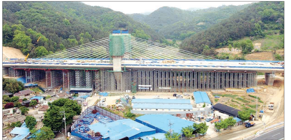
광주 제2순환도로 각화IC~호남고속도로 2.37km구간을 연결하는 사창교 건설현장. 이 일대 주민들은 최근 이 도로 1구간(1.55km) 공사로 소음·진동 등의 피해를 입었다며 광주시와 시공사를 상대로 18억4천575만원의 환경분쟁 조정 신청을 제기했다.