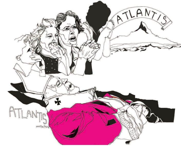
다양한 이상사회의 모습을 그린 ‘유토피아’는 현실에 대한 준엄한 비판이자, 역사에 대한 도전이기도 했다. 베이컨의 ‘새로운 아틀란티스’를 스케치한 삽화.

결코 ‘실현될 수 없는’ 이상사회는 20세기 들어서 역방향으로 출구를 잡는다. 인간의 어두운 미래를 예견하는 반 유토피아, 디스토피아(dystopia)가 과학소설의 새로운 형식으로 등장한다. 예프게니 자마틴의 ‘우리들’, 울더스 헉슬리의 ‘멋진 신세계’, 조지 오웰의 ‘1984’가 대표적이다. 자마틴은 ‘우리들’에서 디스토피아 문학이라는 새로운 장르를 개척했다. 그는 국가가 인간의 욕망과 상상력을 말살하기 위해 온갖 수단을 강구하는 상황을 그림으로써 전체주의 사회의 도래를 예견했다. 헉슬리는 ‘멋진 신세계’를 통해 부화장치로 인간을 대량생산하고 집단양육하는 ‘끔찍한’ 사회를 묘사했다. 조지 오웰은 ‘1984’에서 독재자인 빅 브라더(Big Brother)가 텔레스크린으로 모든 국민의 사생활을 끊임 없이 엿보는 등 극단적으로 사생활이 침해되는 미래사회를 제시했다. 20세기 후반에는 후기 산업사회의 이상향을 찾는 다양한 유토피아 형태들이 등장한다. 정원도시의 건설을 꿈꾸는 디자인 유토피아(design utopia), 환경오염과 생태과 파괴를 저지하려는 에코토피아(ecotopia) 등 다양한 유토피아가 그것이다. (글리온·2만5천원) /윤영기자 penfoot@kwangju.co.kr