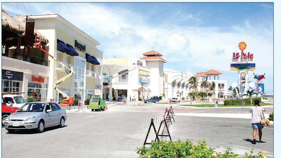
칸쿰 시내에 자리잡은 쇼핑센터. 칸쿰에서는 휴양과 함께 다양한 쇼핑도 즐길 수 있다.

특히 단기 순이익을 노리는 외국자본의 폐해는 거의 없는 편이며 미국, 스페인 등 외국자본에 의한 개발의 순기능이 더 크다는 점은 칸쿰의 매력이다. 또 관광지 조성 사업의 성공으로 정규인구가 늘어 개발사