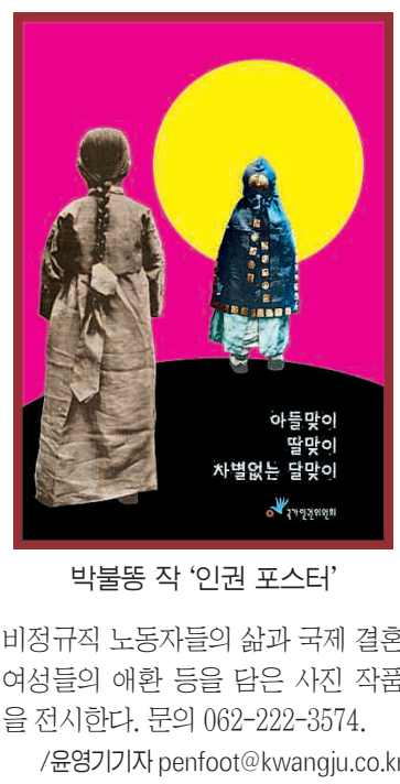
박복동 작 '인권 포스터'

5·18 광주민주화운동 27주기를 맞아 '인권'을 주제로 5월 인권정신을 되새기는 전시가 열린다. 국가인권위원회가 주최하고 광주 시립미술관 등이 주관하는 '인권만화·사진·영화·포스터전'이 20일까지 광주시립미술관 금남로 분관과 옛 전남도청 별관 전시실에서 개최된다. '달라도 같아요'를 주제로 열리는 이번 전시회 작품들은 지난 2002년부터 국가인권위원회의 기획으로 만화, 사진, 일러스트레이터 등 작가 80명이 참가해 5년 여 동안 제작한 것이다. 전시는 모두 5개 부문으로 나뉘어 열리며 인권만화 프로젝트에서는 가정 폭력을 다룬 '누렁이 1.2', 이주노동자의 현실을 담은 '코리아 환타지' 등 만화가 소개된다. 인권사진 프로젝트에서는 사진작가 김종만, 김문호씨가