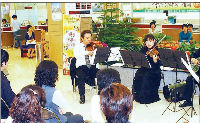
광주필하머닉 오케스트라의 후원자 모집 기획프로그램 '백설공주와 일곱 난장이'의 첫번째 무대가 지난 8일 광주 북광주우체국에서 열렸다.

후원기업·개인 직접 찾아나서는 '아름다운 만남' 공연장에 그림 전시 등 기업과 함께하는 행사도