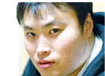
는다고 생각했어요. 그래서 재미있게 그리는데 중점을 뒀습니다. 더 많은 사람들이 만화를 봐서 5·18에 대해 알고 기억했으면 좋거든요.”

“많은 이들이 회생당했고 아직도 고통을 안고 살아가는 사람이 많은데 그 말을 듣고 그가 누우지 않