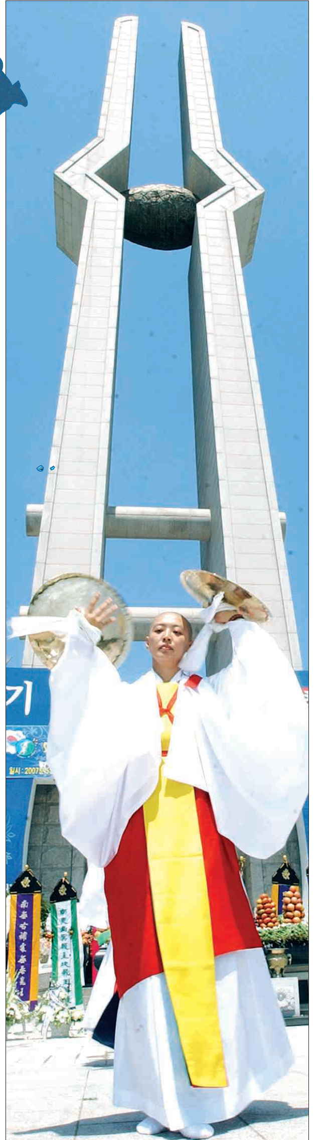
천도재 17일 5·18 민주항쟁 추모탑 앞에서 열린 천도재(薦度齋). '전통불교연합회' 소속 10여 명의 스님들이 5월 영령들의 넋을 극적으로 인도하고 있다.