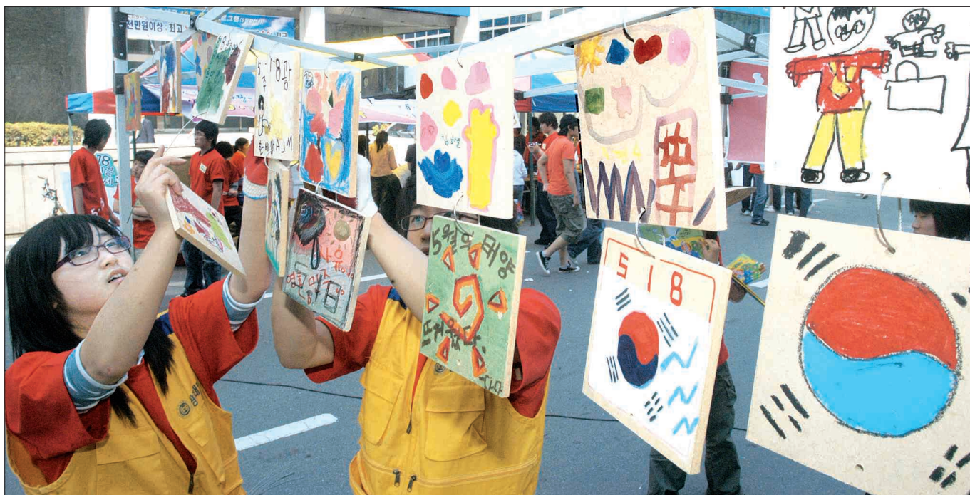
희망 모빌 만들기 광주대학교 사회복지학부 동아리 '바다' 회원들이 금남로에 마련한 '희망 모빌 만들기' 행사. 어린이들이 직접 그린 태극기와 가족의 모습을 담은 모빌 350개를 매달며 통일과 세계평화를 기원했다.