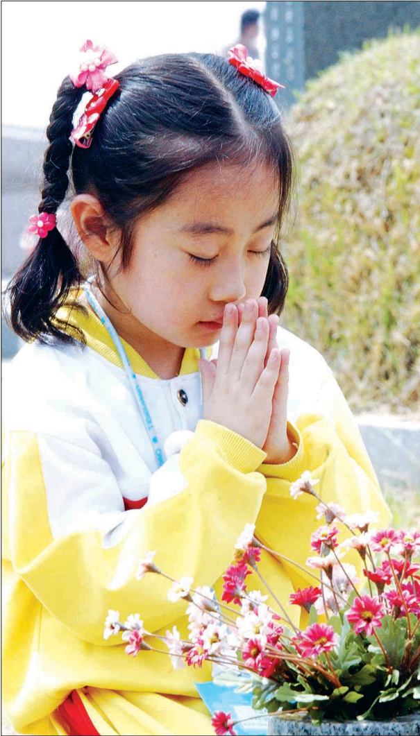
영령들의 명복을 빈다 국립 5·18 민주묘지를 찾은 유치원생이 고사리 손을 모아 영령들의 명복을 빌고 있다.

올해도 어김없이 오월은 돌아왔다. 망월 묘역엔 낮고 잔잔한, 구슬픈 5월 만가(挽歌)가 다시 울려 퍼지고 있다. 광주는 그러나 한(恨)과 눈물을 용서와 화해로 승화시키고, 통일과 평화의 디딤돌로 곧추 일으켜세우고 있다. 5·18 민주항쟁 제27주년을 맞는 광주의 모습을 카메라에 담았다.