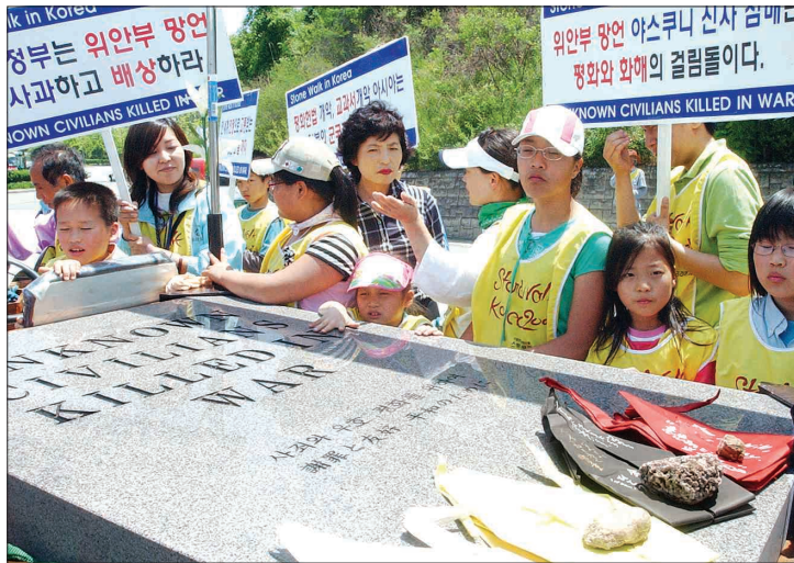
스톤워크 코리아 국제반전평화순례단인 '스톤워크 코리아 2007' 회원 40명이 '전쟁에서 숨진 무명 시민들'(UNKNOWN CIVILIANS KILLED IN WAR) 이라고 새겨진 1t 돌비석을 17일 5·18묘지에서 금남로로 옮기고 있다.