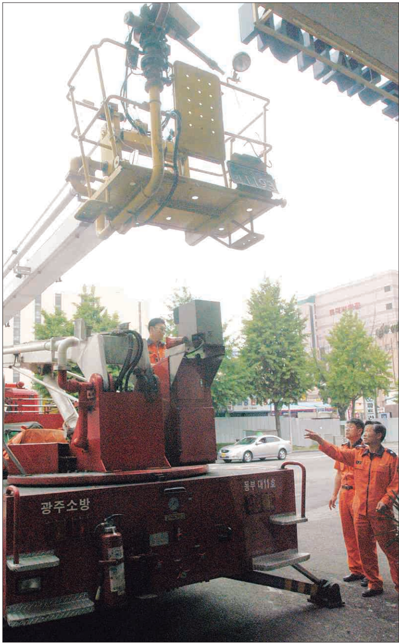
광주동부소방서 대원들이 21일 오전 굴절사다리차에 대한 특별안전 점검을 하고 있다.