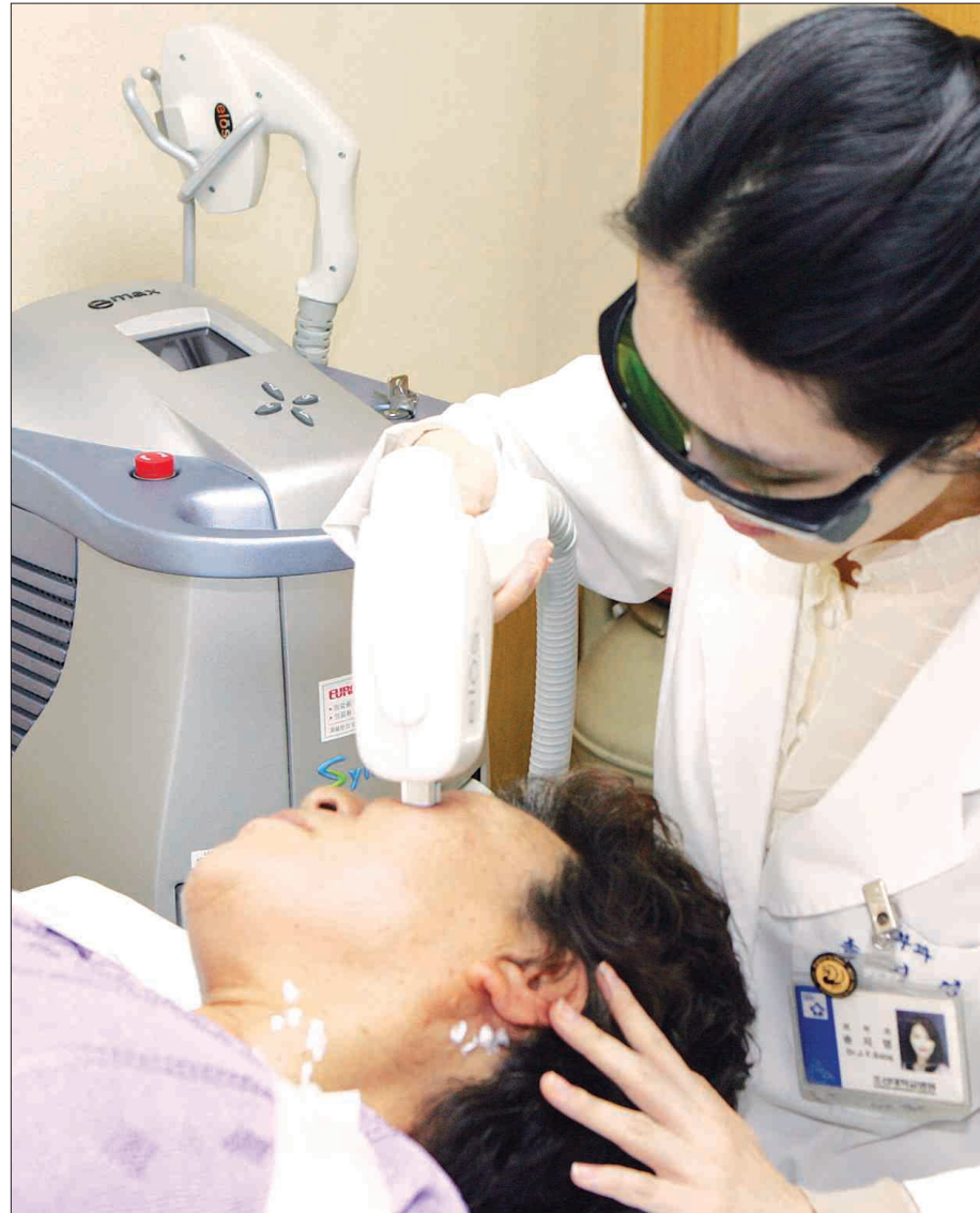
최근 자외선 과다 노출로 인해 기미·주근깨 등 색소질환을 호소하는 환자들이 크게 늘면서 한 환자가 조대병원 피부과에서 치료를 받고 있다.

조선대병원 피부과 최규철 교수는 "자외선으로부터 스스로 보호할 필요가 있고, 자외선 차단에 따른 특징을 제대로 알고 그에 맞춰 대비하는 것이 건강을 보장받을 수 있다"고 밝혔다. <자외선이 피부에 미치는 영향=생활자외선은 계절에 상관없이 파장이 긴 근적외선부터 자외선 A까지 광대역에 걸쳐 있어 피부와 눈, 호흡기를 자극하고, 피부에 광선각화증, 피부노화, 피부암까지 일으킬 수 있다. 특히 여름철에 갑자기 햇빛에 노출돼 발생하는 일광화상은 햇빛 속에 포함된 자외선에 의해 발생한다. 증상은 피부에 가려움증과 따끔거리는 증상과 함께 붉은 반점이 나타나고, 점차 부풀어 오르다가 심하면 물집이 생긴다. 정도에 따라 오한·발열 등의 전신증상이 나타나는 경우도 있다. <예방 및 치료=이런 자외선은 백사장이 나오면 잘 반사하는 특징이 있다. 따라서 바닷가에서는 아침 10시부터 오후 3까지는 햇빛 노출을 적게 하고 자외선 차단제를 반드시 발라야 한다. 노출 당시 피부에 별 탈이 없다고 밤잠을