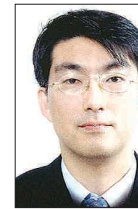
-전남대 대학의학과 박사과정 -서울대병원 임상 강사 -경상대병원 류마티스내과장 -대한내과학회·대한류마티스학회 -대한노인병학회·아시아태평양 류마티스학회 회원