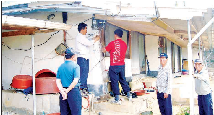
농촌공사 전남본부·나주 함평지사