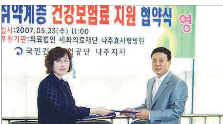
건강공단 나주시지사-나주 효사랑병원

이 사업이 마무리될 경우 친환경 농산업 기반조성과 함께 국제경쟁력 확보, 연관사업 투자유치와 일자리 창출 등에 기여할 것으로 기대된다. /홍행기자 redplane@