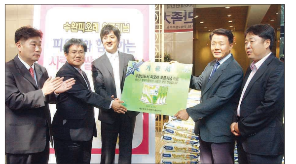
대주건설은 지난 25일 광주시 광천동 대주하우정갤러리에서 전속 광고모델인 영화배우 정준호씨와 정치권 대주건설 주택사업본부장 등이 참석한 가운데 ‘사랑의 쌀’ 200포대를 광주 광산구청에 전달했다.