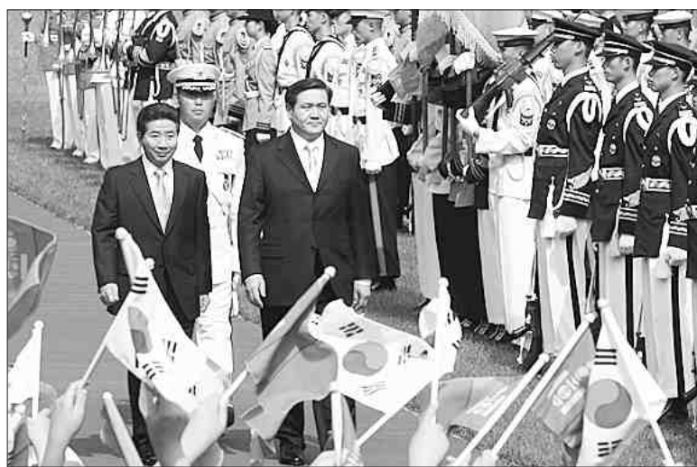
한·몽골 대통령 의장대 시열 노무현 대통령과 방한중인 남버린 엠호바야르 몽골 대통령이 28일 청와대에서 열린 공식환영식에서 의장대를 시열하고 있다. 연합뉴스

회원국의 수학적 역량을 측정, 대상 국가의 등급을 I~V로 5단계로 평가한 뒤, 회원국의 투표를 통해 등급을 최종 확정한다. 우리나라는 이미 회원국 투표에서 압도적 지지를 얻어 등급 IV로 확정돼 6월 1일자로 이 등급을 적용받는다. IMU의 국가별 등급은 IMU 집행위원회나 IMU 총회 등의 각종 행사에서 각 나라의 투표권 수를 의미한다. 연합뉴스