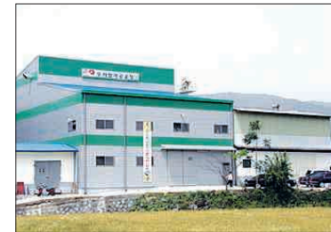
특히 가공처리 능력이 커짐에 따라 구례는 물론 인근 시·군에서 생산된 우리 밀까지 매일할 수 있게 돼 밀 제분업의 소득안정에 기여할 것으로 기대된다. ※구례=김동호기자 dhkim@

또 제분 등의 품질을 크게 향상시켜 우리밀의 국내·외 경쟁력을 한층 높일 수 있게 됐다.