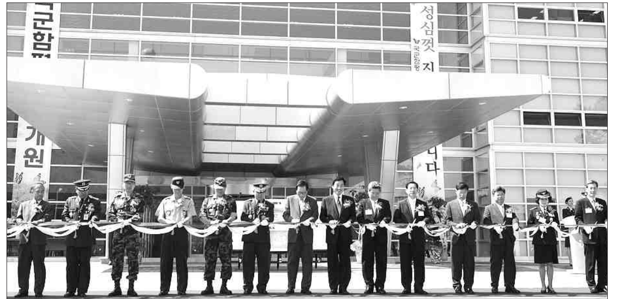
국군함평병원 개원 광주에서 함평군 해보면으로 옮겨간 광주국군통합병원이 국군함평병원으로 이름을 바꿔 30일 개원했다. 이날 개원식을 가진 국군함평병원은 의료진 150여명, 부지 18만㎡, 500병상을 갖춘 지하 1층, 지상 4층의 규모다. 지난 2005년 2월 착공했으며 726억원의 사업비가 투입됐다.

지난 1993년 46만3천651명으로 '반 토막' 난 뒤 2005년(29만8천101명)에는 다시 30만명의 '벽'이 무너지면서 교육 황폐화가 심화되고 있다. 전남은 또 보성, 구례, 곡성 등 초고령화 사회로 접어들어 상당수 시·군을 중심으로 학생 감소 현상이 한층 뚜렷하게 나타나고 있다. 실제 전남은 올해 초등학교 전체 604곳(보교 152곳) 가운데 34곳(단교 33곳)이 신입생이 한 명도 없었고 신입생이 1명인 학교도 31곳(보교 28곳)에 달했다. /최경호기자 choice@kwangju.co.kr