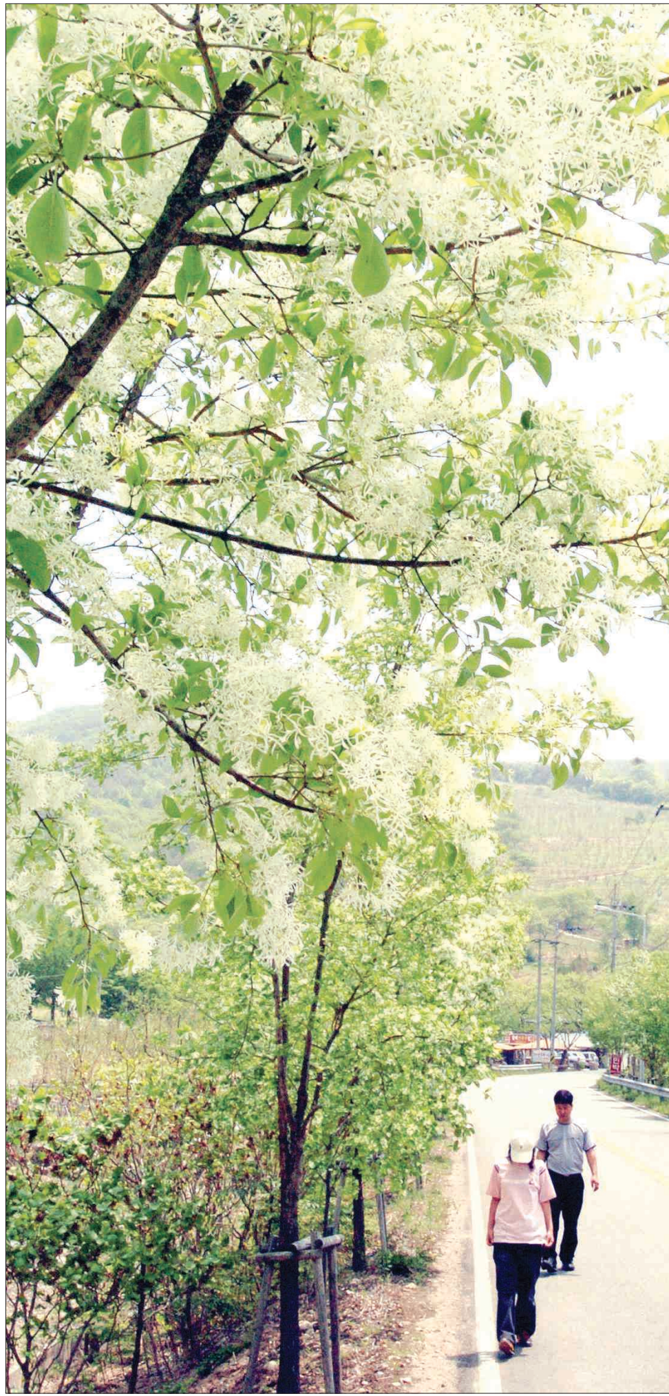
경남 밀양시 단장면 경남주유소에서 고래리 평리마을 가는 5km 도로에 펼쳐진 이팝나무 가로수길이 관광객들을 유혹하고 있다.

▲만어사 = 서기 46년 가락국 수로왕이 창건하였다고 전해지는 만어사는 풍도사의 말사, 구불구불한 산길을 따라 차로 10분 정도 올라가야 만날 수 있는 절이다.