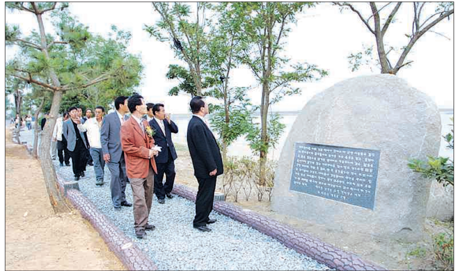
지난해 말 장흥군 안양면 울산마을 여다지 해변에 조성된 '한승원 문학산책로'. 2억여원을 들여 만든 시비 30여개가 해변가 600m 구간에 세워져 있다.