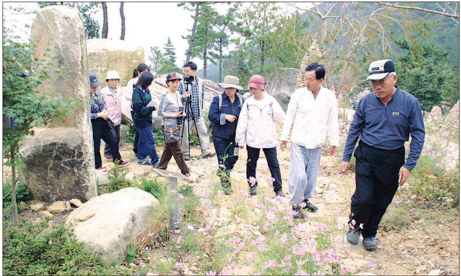
관람객들이 장흥군 대덕읍에 조성된 천관산 문학공원을 둘러보고 있다. 이 곳에는 국·내외 문인들의 유명 글귀 50여개를 이용한 문학비가 들어서 있다.