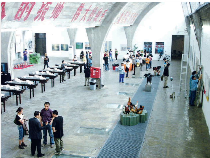
광주미협과 광주시립미술관이 지역 작가들의 해외 진출을 위해 중국 베이징 '798 예술특구'에 전시장 개설을 추진중이어서 관심을 모으고 있다. 사진은 '798 예술특구' 전시장 전경.

전에 기여하는 것은 물론 광주를 아시아 문화중심도시로서 자리매김하는 데 기여하게 될 것이다"고 말했다.