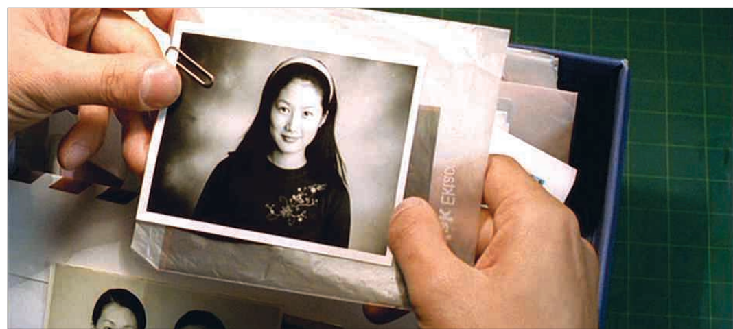
사진은 '존재 증명'을 잘 드러내는 장르다. '8월의 크리스마스'에서 정원은 다림의 초상사진을 찍고 자신의 영정사진을 찍으며 생을 정리한다.