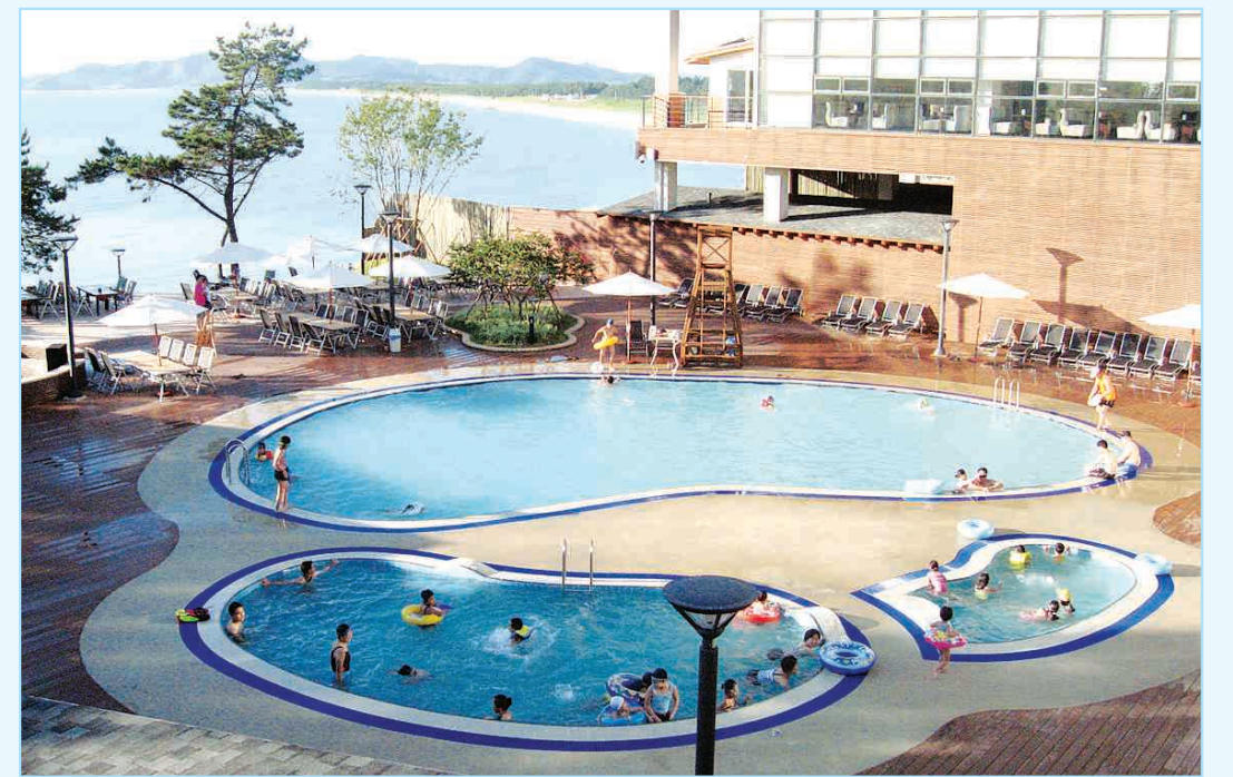
온가족이 함께 즐길 수 있는 엘도라도 리조트 아이수영장.

엘도라도 리조트에서 약 4km만 벗어나면 60만평의 천연게르마늄 갯벌이 펼쳐진다. 이곳에서 5분 거리에 위치한 증도 태평염전은 어른의 삶을 온몸으로