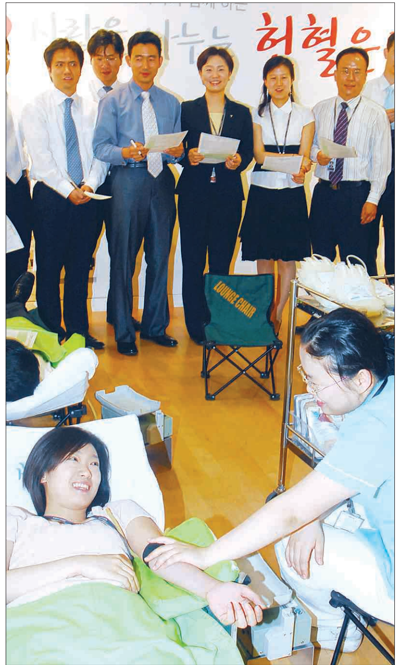
'아름다운 기업' 단체 헌혈 금호아시아나그룹 임직원들이 7일 서울 금호아시아나빌딩내 금호아트 갤러리에서 헌혈운동에 동참하고 있다. 금호는 오는 14일 세계 헌혈의 날을 기념하고 '아름다운 기업' 7대 실천과제 중 하나인 헌혈운동 실천을 위해 7~14일 그룹 차원의 단체 헌혈에 나섰다.