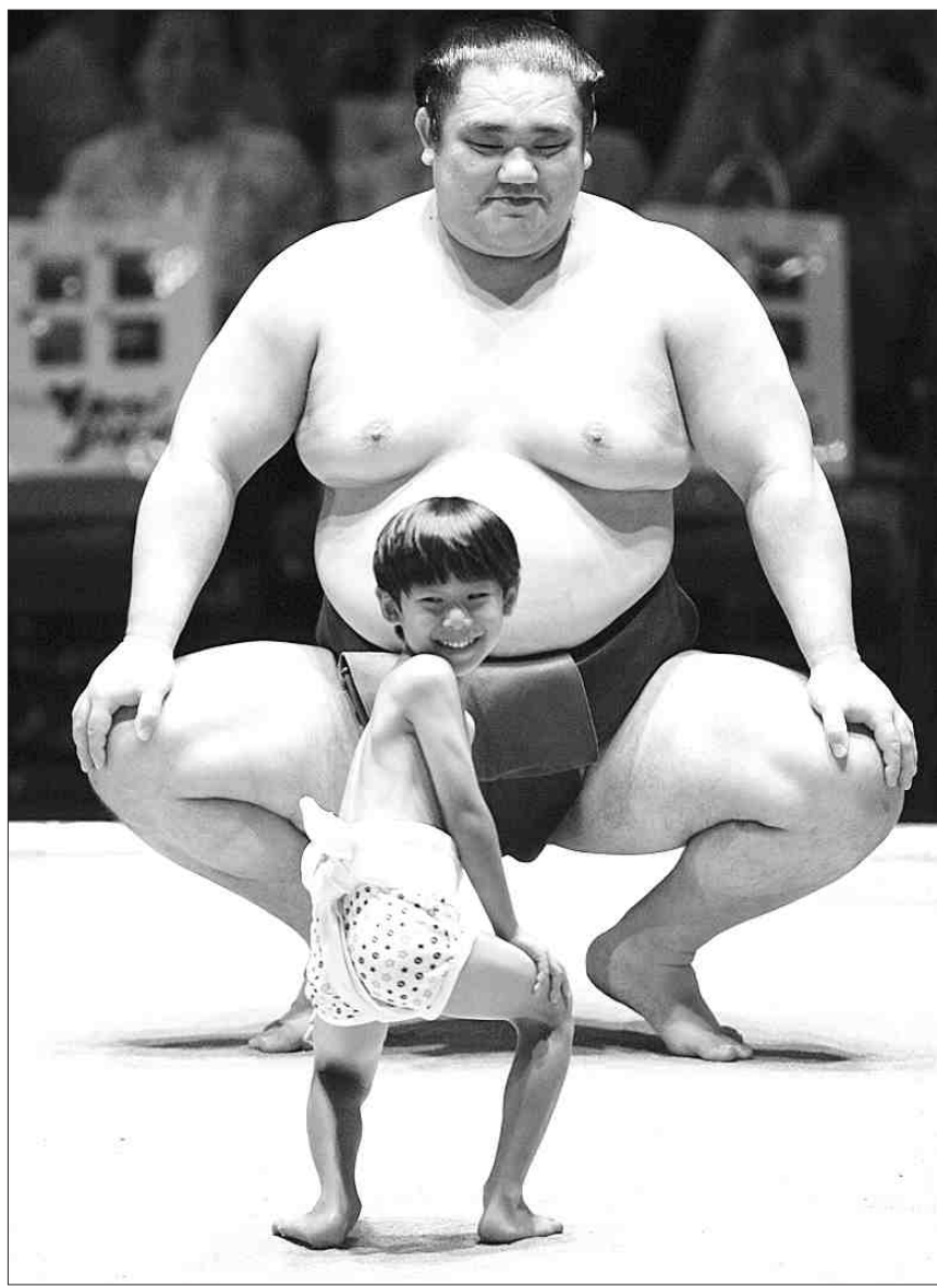
다윗과 골리앗 한 어린 소년이 10일 하와이 호놀룰루의 네일 S. 블레이즈 경기장에서 '그랜드 스모 토너먼트' 이틀째 경기 시작에 앞서 열린 시범경기에서 한 프로 스모 선수와 대결 준비 자세를 취하던 중 멧돼지 두 뒤를 돌아보며 웃고 있다.

가 불만족스럽다고 답했으며 40대(74.7%), 30대(66.3%), 20대 이하(61.4%) 순으로 나이가 많을수록 노 대통령에 대한 '불만족' 비율이 높았다. 소득수준별로는 월 평균 250만~349만원 소득 계층의 76.5%가 '불만족' 응답을 내렸으며 150만~249만원(74.4%), 149만원 이하(60.1%) 등이었고 350만원 이상은 70.4%였다. 이번 설문조사는 여론조사 전문가인 한국 갤럽에 의뢰해 작년 하반기 제 주도를 제외한 전국 성인남녀 1천200명을 대상으로 방문면접조사 방식으로 이뤄졌다고 정책지식센터는 설명했다. /연합뉴스