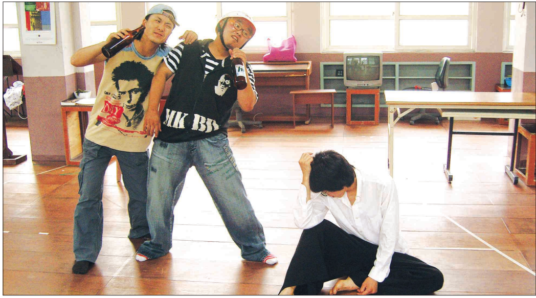
유쾌한 코미디 작품을 만날 수 있는 제10회 소극장축제가 15일부터 7월1일까지 광주공동예술극장 등에서 열린다. 사진은 '푸른연극마을'의 '바보' 연습 모습.

품 중 하나다. 계속되는 불경기에 물가마저 오르지 않네 여자들은 슈퍼마켓에서 물건을 집어 들고 나온다. 신고를 받고 출동한 경찰과 여자들의 추격전이 이어지고, 여자들이 훔친 물건을 옷 속에 감추면서 '임신'이라는 해프닝으로까지 이어진다. 극단 'Y' 작품으로 박규상·심성일 씨 등이 출연한다.