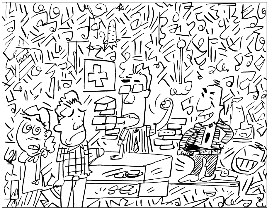
찾아보세요 서툴룩, 촛불, 펜촉, 열대어, 사람옆 얼굴, 바늘, 당근, 성냥개비, 다리미