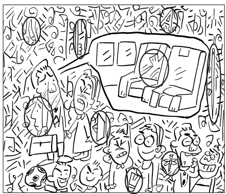
지난주 정답 종이배, 바늘, 사람옆 얼굴, 서툴룩, 짐자리, 칫솔, 고추, 알파벳 A자, 열대어