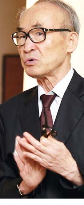
광주우체국 사랑봉사대 '무료 급식'

사람은 이승만, 김대중 전 대통령 두 명에 불과했다”고 회고한 뒤 특히 “이 전 대통령은 늘 문장화된 문자언어를 썼으며 비서가 써주는 문장이 아닌 자기만의 문체가 있었다”고 평가했다. 특히 시인은 눈, 코, 입 등 사람의 신체기관을 통한 안과 밖의 만남을 강조하는 대목에서 “대선 정국 아래에서는 자기 언어만이 진리고 정이다. 자신의 입만 알지 귀의 소중함은 잊고 있다”면서 “지금 우리는 귀는 없고 입만 필요한 시점에서 뜨겁게 살고 있다”며 현 정치권을 향해 소리를 쳤다.