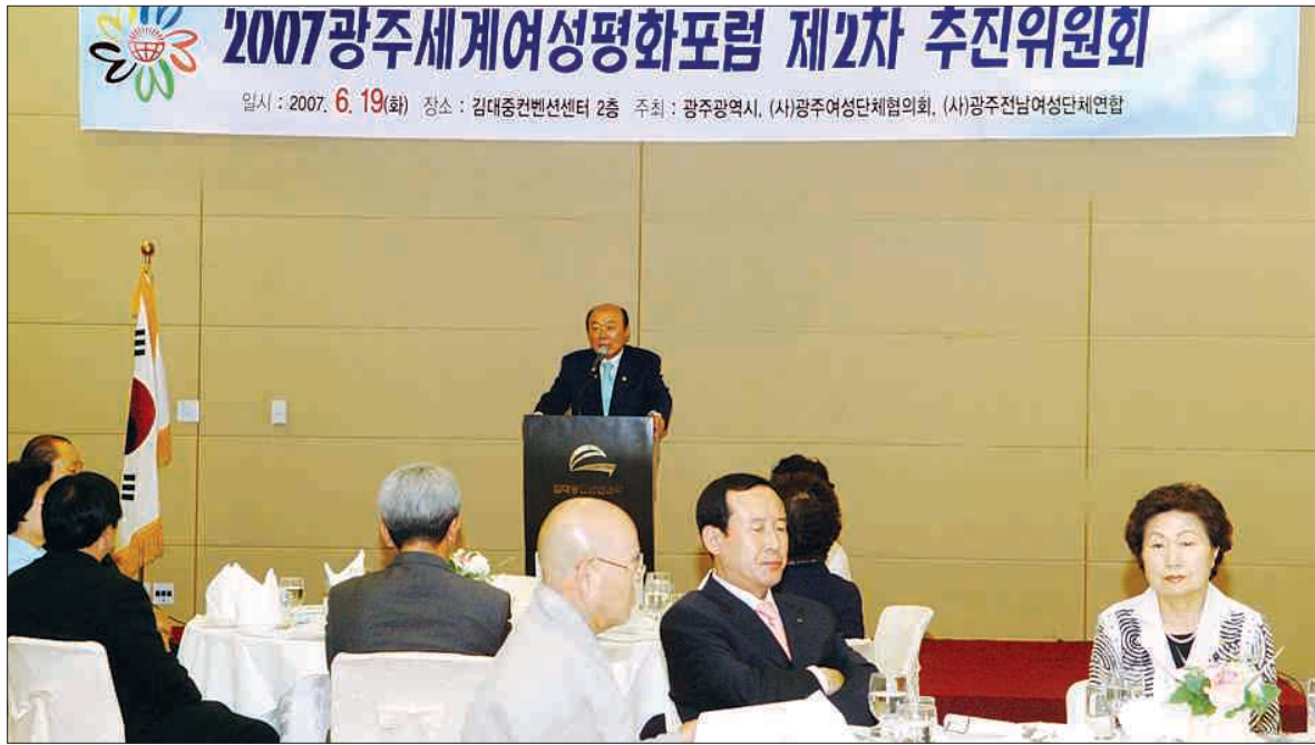
2007광주세계여성평화포럼 추진위원회 위원들이 19일 광주 김대중컨벤션센터에서 광주시로부터 포럼 준비상황을 듣고 있다.

은 봉투는 판매처에서 차액을 지급하고 새로운 봉투로 교환해 사용해야 한다. ▷북구는 쓰레기 수거일 변경=북구는 봉투 가격 인상에 맞춰 단독주택 및 상가 등의 생활쓰레기와 재활용품 수거일도 변경한다. 현재 북구 거주자들은 생활쓰레기와 재활용품을 요일에 관계없이 배출하고 있지만, 다음달부터는 생활쓰레기와 재활용품을 해당 수거 요일 전 오후 8시부터 당일 오전 6시 사이에 배출해야 한다. 생활쓰레기 수거일은 월·수·목·토요일 주 4차례이며 재활용품 수거일은 화·금요일 주 2차례다. /이종행·김여울 기자 golee@kwangju.co.kr