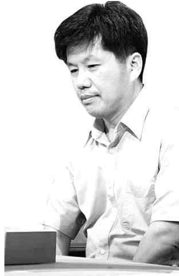
반)의 속하기전이다. 결승전은 3번기로 진행하며 우승자는 2단, 준우승자는 1단의 특별 승단혜택이 주어진다. 우승상금은 4천 500만원(준우승 1천800만원)이다.

바둑TV, 세계사이버기원 3사가 공동 주최하는 전자랜드배는 제한시간 각 10분에 초읽기 40초 3회(덤 6집