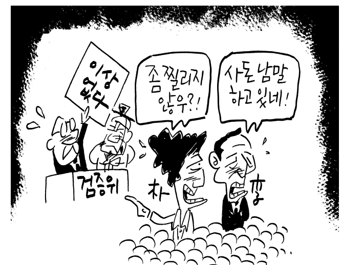
얼굴은 두껍고 불일이다